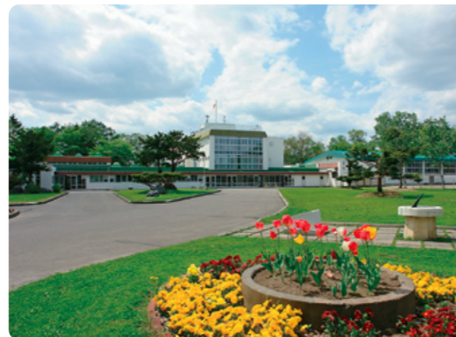
▲附属旭川小学校校舎入口