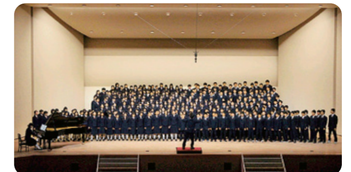
▲ 附中フェスティバル文化祭