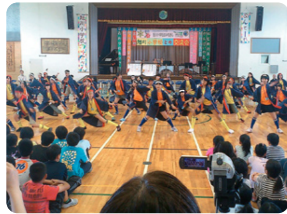
道徳教育として実施している沖縄の小学生との交流 ▶

附属旭川小学校では、1時限ごとの道徳指導計画を作成して指導と評価の充実を図るなど、道徳教育の充実に努めています。毎年11月に開催される全校道徳参観日には、全学級が、「家庭や地域」と「道徳の時間」とのつながりを重視した授業を公開しています。あわせて、保護者や地域住民等を対象とした教育講演会も実施し、児童にとっては、家族愛や命の大切さなどについて考えを深める機会となっています。