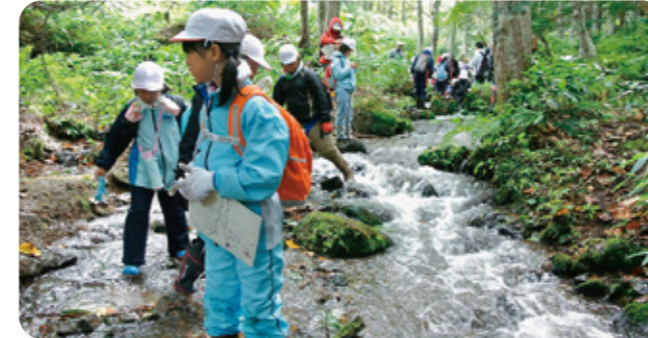
▲ 雄大な自然の仕組みを学ぶ～環境教育～

附属釧路小学校では、道東の厳しくも豊かな自然条件の下で、教職員と保護者が協力して「あかるく、かしこく、なかよく、たくましい北国の子」を育てています。また、児童の自発的、自治的な活動を重視するとともに、食育や環境教育をはじめとする教育活動全体で体験や個に応じた指導の充実を図り、中学校の3年間を含めた9年間を見通した中で、「今しか味わえない学び」をふんだんに提供しています。