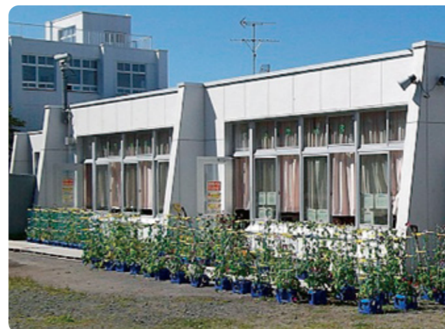
▲附属釧路小学校校舎