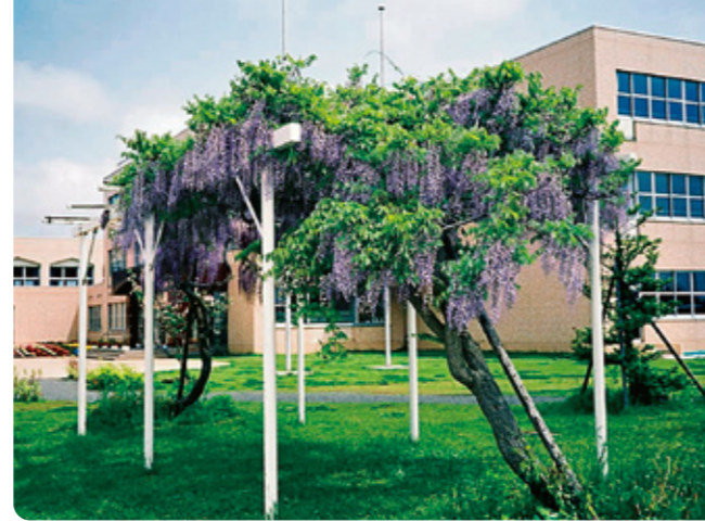
▲附属札幌小学校玄関前の藤棚