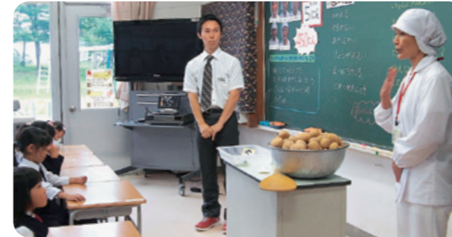
▲ 作り手の視点から自らの食生活を見直す～食育～