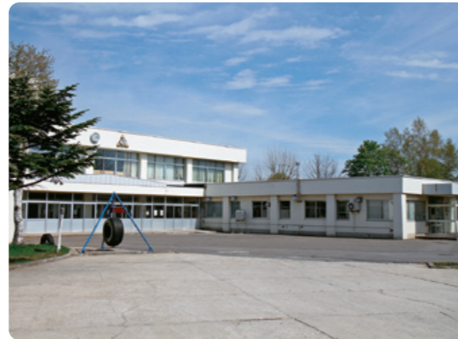
▲附属函館小学校校舎入口