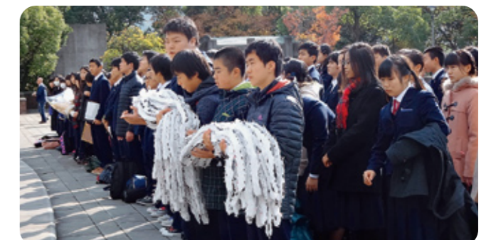
▲ 2年生の長崎における宿泊研修「平和宣誓セレモニー」での様子

附属釧路中学校では、「脳に汗をかく」を合い言葉に、教師は教育に対し、生徒は学習に対し、それぞれ「楽しくてしかたない」と思えるような気風のもと教育の充実を図っています。部活動にも力を入れており、全道大会や全国大会に毎年出場しています。また、「学力の伸長」を重視した小中一貫教育を実現するために、小中学校の授業相互観察や相互乗り入れ授業などを実施し、小中合同研究会などでの検討を重ねながら、小学校・中学校の9年間を見通したカリキュラムの開発に取り組んでいます。