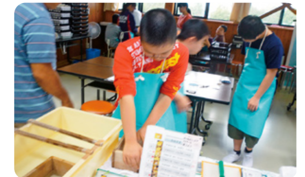
▶ 牛乳パックで紙すきをする生徒

附属特別支援学校では、「人とかかわり合いながら自分の良さを発見し、広げ、地域で生きる児童生徒の育成」を目指しています。北海道教育大学唯一の特別支援学校として、特別支援教育実習を函館キャンパスのみならず、他キャンパスや他大学からも受け入れるとともに、「特別支援教育における現職教員研修」に関する研究プロジェクト等を計画・実施しています。