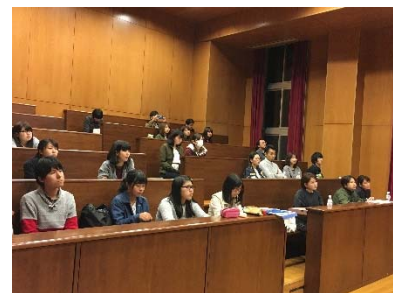
熱心に聞き入る若者たち