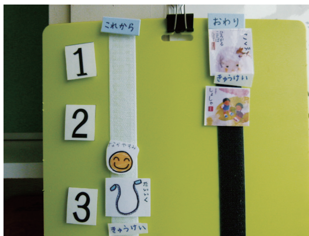
写真1 生活見通しボード

このボードは、学校生活に見通しをもって行動することが苦手な児童のための手立てであるが、他の児童にとっても分かりやすいツールとなっている。この「生活見通しボード」を通して、次の行動になかなか移れなかった児童が、自信をもって友達に次の時間割を教えるなど会話も増え、コミュニケーション能力を向上させる場ともなっている。