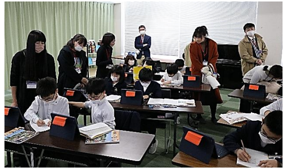
3年生～iPadを使いながら学習中～

昨今は、感染症対策で、なかなか保護者の皆様に学校の様子を見ていただく機会が少なくなっておりますが、子供たちの学習の様子はいかがでしたでしょうか？前回の学校便りで副校長より「行事を点として捉えるのではなく、校訓【強く・明るく・正しく】という目標へのプロセス」ということをお話させていただきました。10月の桐の子発表会を終え、次の学年へと向かって自分なりの目的と目標をもって学びに向かう姿をご覧いただけるよう授業参観を実施したつもりでおります。今年度も早いもので残り4カ月となってしまいましたが、これからも「目的と対話」を大切にしながら、次の学年へと向かっていけるよう尽力してまいります。