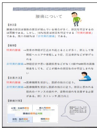
【健康情報・料理レシピのポスター】