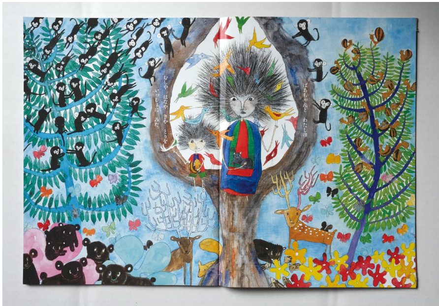
『ばあちゃんがいる』伊藤比呂美・文 MAYA MAXX・絵 福音館書店