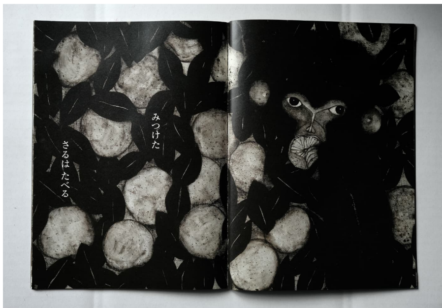
『さるがいつびき』MAYA MAXX 福音館書店